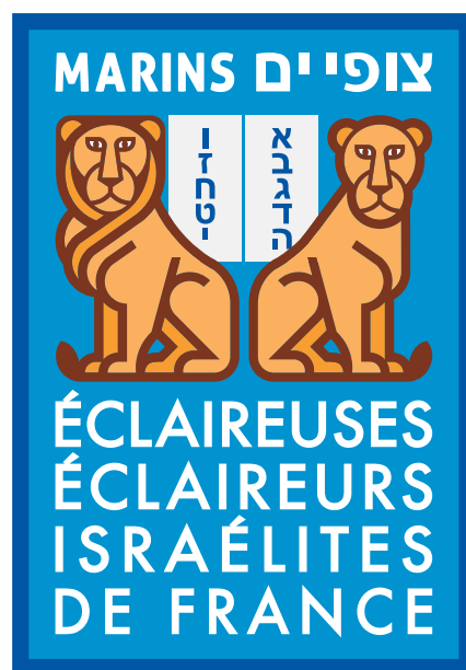
INSIGNE DES TSOF'EI YAM (Tsofé Yam, scouts marins en hébreu)