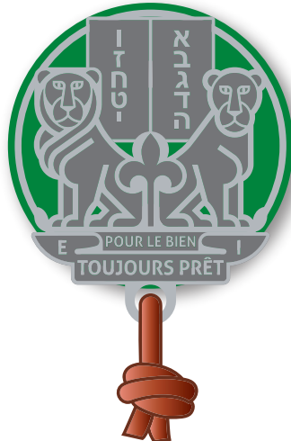
ZADEK, PIF rondelle cuir et boucles d'épaules vert BM, orange BP