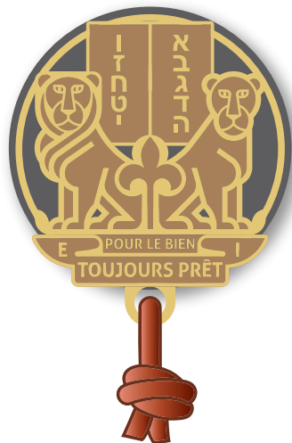
RESPONSABLE DE GROUPE LOCAL rondelle cuir et boucles d'épaules gris RGL