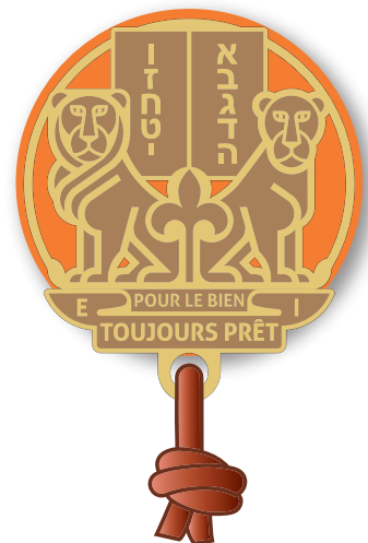
RESPONSABLE BP rondelle cuir et boucles d'épaules orange BP