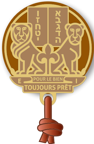
ÉQUIPE RÉGIONALE rondelle cuir marron boucles d'épaules marron foulard bleu au liseré marron