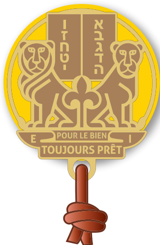
RESPONSABLE BC rondelle cuir et boucles d'épaules jaune BC