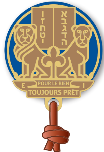
LES SEMEURS rondelle cuir bleu boucles d'épaules bleu foulard bleu foncé IFJS au liseré bleu