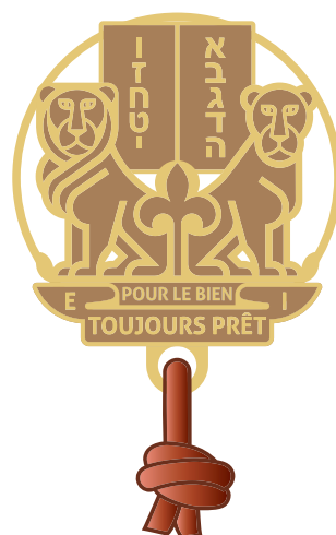
ANIMATEUR boucles d'épaules aux couleurs BC, BM ou BP