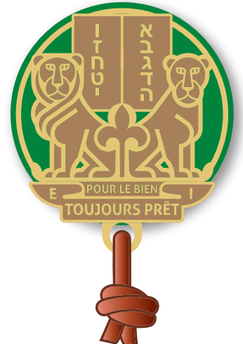
RESPONSABLE BM rondelle cuir et boucles d'épaules vert BM