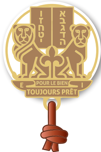
ÉQUIPE NATIONALE rondelle cuir blanc boucles d'épaules blanc foulard blanc bordé tricolore

Sept rondelles de cuir symbolisent les engagements, du zadek à l'équipe nationale.